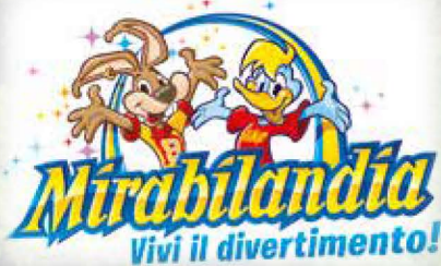
A soli 15 minuti da Mirabilandia, uno dei parchi divertimento più belli e divertenti d'Europa Just 15 min. far from Mirabilandia, one of the best and most amusing fun parks all over Europe