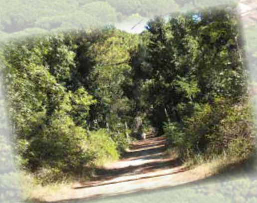
La pineta, ideale per mantenersi in forma (0,00 km) The pinewood, ideal for jogging