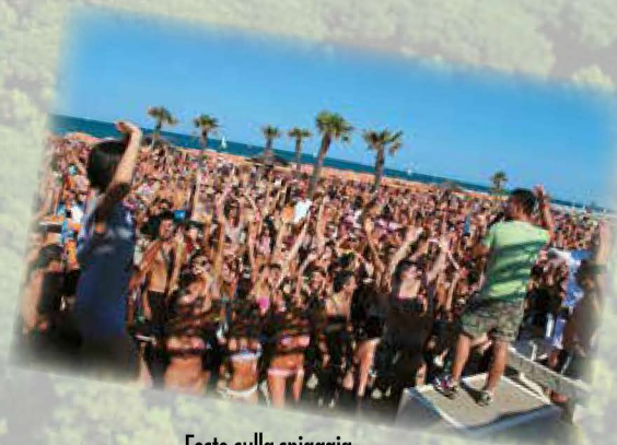
Feste sulla spiaggia Parties on the beach