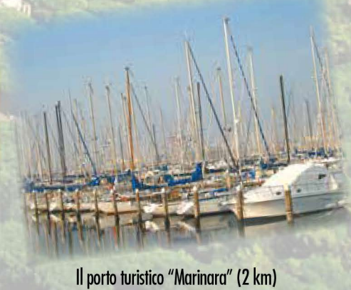
Il porto turistico "Marinara" (2 km) The port for tourists "Marinara"