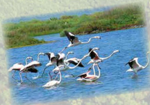
Birdwatching nel parco del Delta del Po Birdwatching in the Po Delta Park