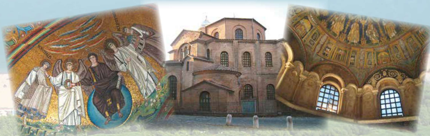
Ravenna, città d'arte e cultura bizantina, dichiarata dall'Unesco Patrimonio dell'Umanità (8 km) Ravenna, famous for its byzantine treasures, a Unesco World heritage site