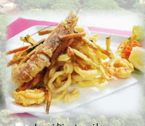
Le specialità gastronomiche Gastronomical traditions