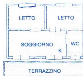
BUNGALOW IN MURATURA

QUIETE e SILENZIO per evitare di invadere la libertà altrui o vedere limitata la propria, i Signori Ospiti sono pregati di rispettare rigorosamente il silenzio dalle ore 24,00 alle ore 7,00 dalle ore 14,00 alle ore 16,00. Inoltre, durante le ore del silenzio NON È CONSENTITO transitare con i veicoli (auto, moto, biciclette, etc.).