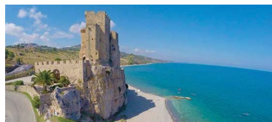
Castello - Roseto Capo Spulico