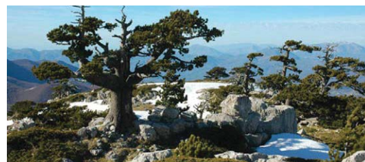
Parco Nazionale del Pollino