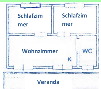
BUNGALOW IN MASSIVBAUWEISE Dreiraum 4 Betten: 60

Die Ruhezeit muss von 24:00 bis 07:00 Uhr und von 14:00 bis 16:00 Uhr eingehalten werden.