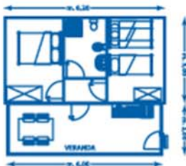
Piantina BILOCALE (mini-casa)