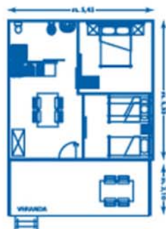
Piantina TRILOCALE MURATURA (mini-casa)

Il presente listino è valido salvo errori di stampa.