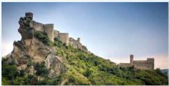
Castello di Roccascalegna