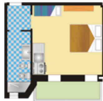
Appartamenti Mono 3 posti letto