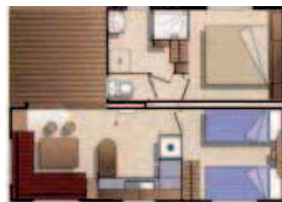
CASA MOBILE 35 m 2