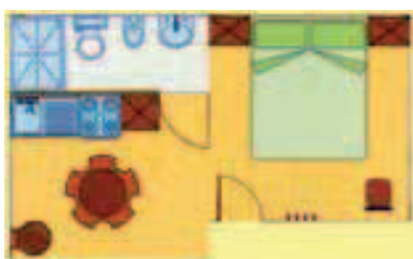
BILOCALE 30 m 2