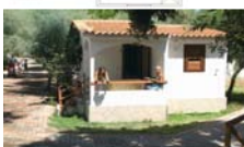
2-Raum Bungalow 4/5 Betten

ZWEIRAUM 4 BETTEN, BUNGALOW (25 m²) Aufenthaltsbereich mit Kochnische und Stockbett. Schlafzimmer mit Ehebett. Bad mit Dusche, überdachte Aussenveranda.