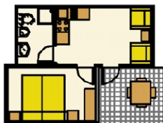
Villetta 3/4 pl