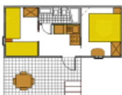
Villetta 4 pl