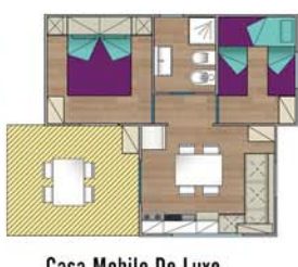
Casa Mobile De Luxe