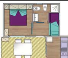
Bungalow Easy Plus