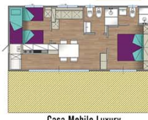
Casa Mobile Luxury

I prezzi dei bungalow comprendono: persone, consumi di luce, acqua e gas, pentole e stoviglie, posto auto vicino al bungalow. Nelle Case Mobili e Bungalow aria condizionata compresa nel prezzo. I bungalow saranno consegnati dalle ore 16.00 del giorno di arrivo e dovranno essere liberati entro le ore 9.00 del giorno di partenza. Il pagamento del soggiorno dovrà essere effettuato all'arrivo ed in caso di partenza anticipata, il cliente, in ogni caso, dovrà pagare l'intero periodo di soggiorno prenotato. La prenotazione dovrà essere perfezionata con l'invio di una caparra pari ad un terzo del periodo prenotato.