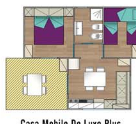
Casa Mobile De Luxe Plus