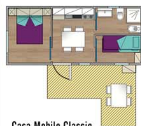
Casa Mobile Classic